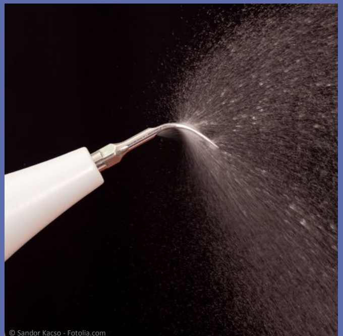
Wassergekühlte Ultraschallspitze für die Entfernung harter Beläge von den Wurzeloberflächen und zur Säuberung der Zahnfleischtaschen

Persönliche Beratung: Telefon: 07032 - 9281-0